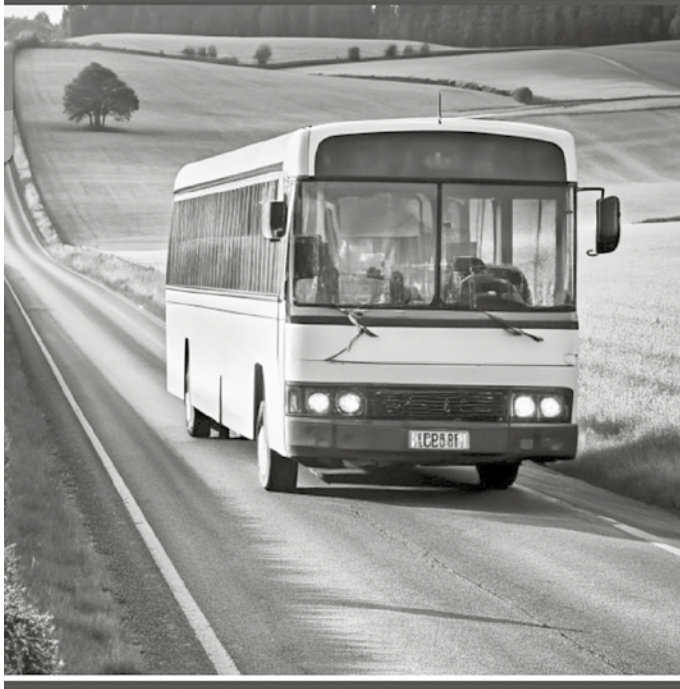
ГРАФИК ДВИЖЕНИЯ ОБЩЕСТВЕННОГО ТРАНСПОРТА

Сайт Администрации Херсонской области: https://khogov.ru/